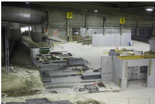
Umbauphase, Ausführung der Lagerboxen

Nach Abschluss der Rückbauetappe RE1A wurde das Areal der Bauherrschaft - bzw. dem Los I für den Umbau der Installationen - bzw. für das Implementieren der betrieblichen Einrichtungen - abgegeben.